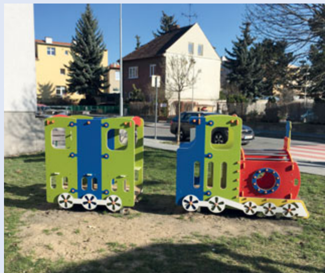
Park Elišky Krásnohorské