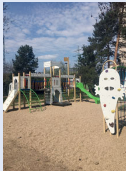
Park Přední – Blatouchová

S jarními svátky souvisí soutěžní akce pro děti Hledání velikonočních vajíček v lesoparku. Pro úspěšné hledače nebude chybět sladká odměna. K měsíci dubnu nepochybně patří výlet s našimi seniory na oblíbenou Floru Olomouc a také 2. ročník Pivního festivalu v parku Řehořova, kde bude k ochutnání desítky druhů piva.