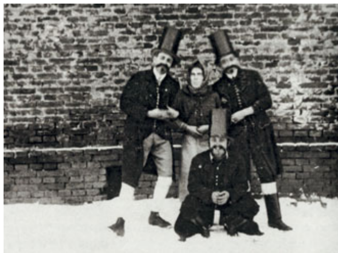
Ostatky v Černovicích v roce 1923.