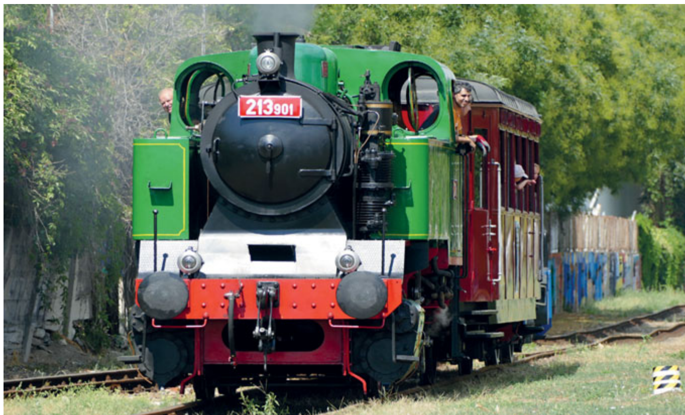
Černovice lemují koleje. Tak tedy plnou parou vpřed!

Předseda Místního sdružení ODS Brno-Černovice