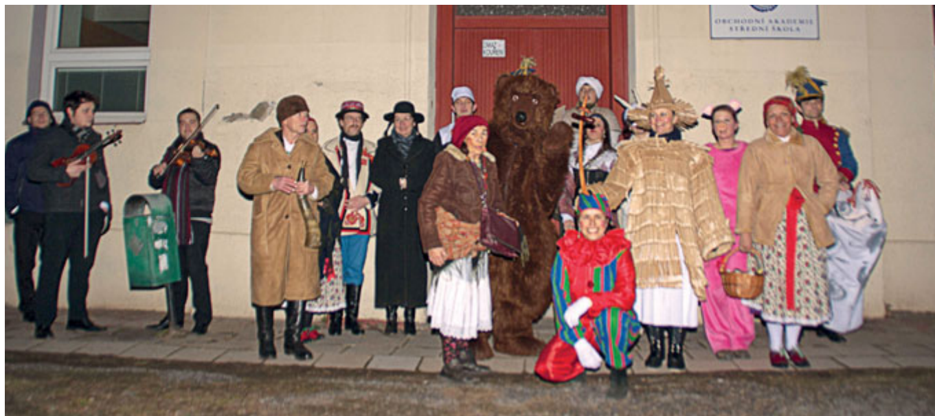
Černovický soubor Májek při průvodu maškar v roce 2017