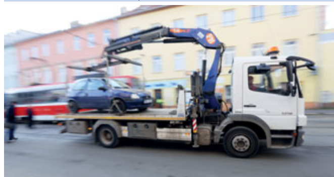
Čištění komunikací se provádí včetně parkovišť a parkovacích zálivů v době od 8.30 hod. do 16.00 hod.