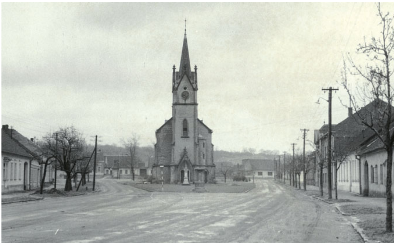
26. září 1899 – slavnostní vysvěcení kostela sv. Floriána

Bývalý kostel sv. Floriána, Faměrovo nám. Kaple sv. Kříže, areál Psychiatrické nemocnice, Húskova ul.