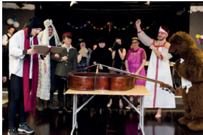
Ostatková zábava a pochování basy