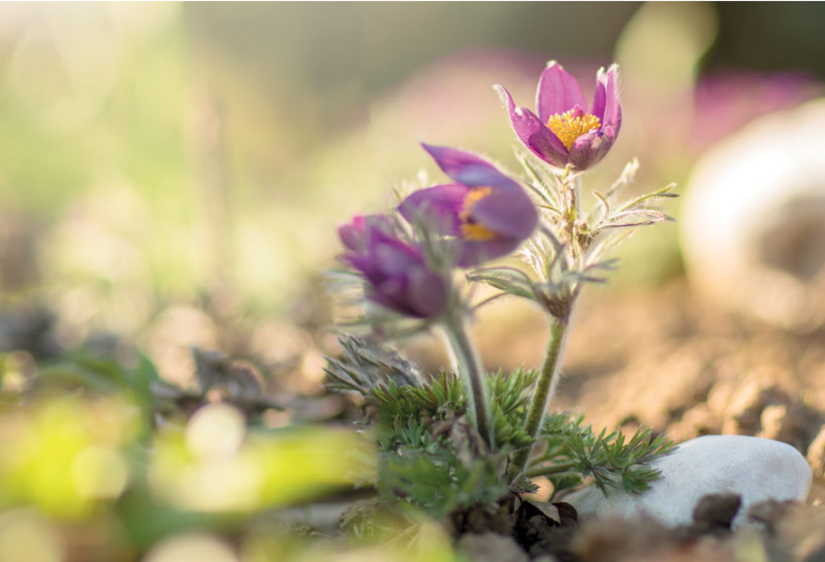
Černovice rozkvétají.