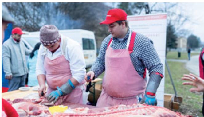
Vepřové hody v parku Řehořova ve spolupráci se SŠ Charbulova