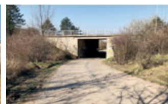
24. 3. jsme uklidili za psychiatrickou nemocnicí a podjezd pod Černovickou