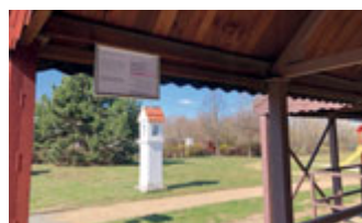
U sv. Floriána přibyla cedule s informacemi o kvalitě vody z pramene