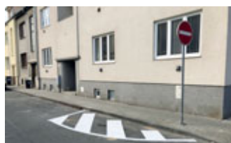
Nové značení pro zpřehlednění křižovatky Spáčilova/Bolzanova

projednávání nového územního plánu a na změnu organizační struktury úřadu, která by měla přinést vznik nového Odboru školství a sociálních věcí a zřízení pozice právníka úřadu. Současná krize zkomplikovala plánovaná projednání důležitých záležitostí s občany, ale ani tady se nevzdáváme a chystáme se ke komunikaci využít online nástroje.