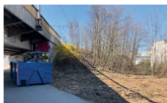
Byl uklizen prostor za lávkou u Turgeněvovy ulice