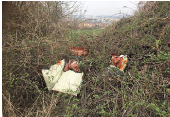
Vjezd na pole nad ulicí Havraní – nově vzniklá černá skládka

Následující fotografie dobře vystihují rozdílné přístupy k veřejnému prostoru v naší městské části.