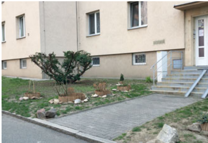
Opečovávaný prostor před domem Turgeněvova 2

Za zodpovědný a inspirativní přístup a péči o nejbližší okolí bychom chtěli poděkovat především paní Hudcové z domu