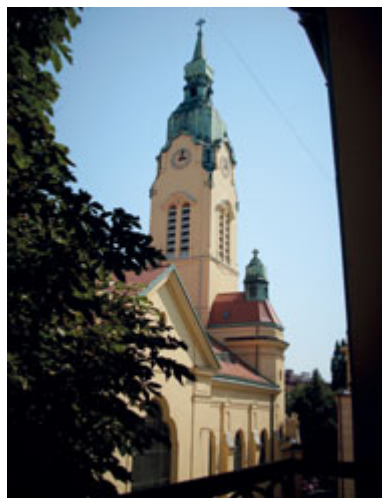
Kostel Neposkvrněného početí Panny Marie, Křenová

Milí spoluobčané! Letošní velikonoční svátky se budou od těch, co jsme dosud zažili, v něčem lišit. Nejen jejich prožitím, ale i přípravou na ně. Velikonoce souvisí s probouzením přírody ze zimního spánku. A musím říct, že i když je v těchto dnech celý náš národ v karanténě kvůli koronaviru, můžeme přesto zažívat první pěkné jarní dny. Život v přírodě se pomalu probouzí a to mi dodává naději, že i naše společnost se probouzí k novému životu. Tato krize nás může jako národ změnit a může nám pomoci chovat se k sobě navzájem lépe, než se nám to dosud dařilo. Máme čas se na chvíli zastavit a přehodnotit naše jednání i to, kam směřujeme jako jednotlivci i jako národ. Můžeme přestat myslet jen na sebe a začít myslet na ty, kteří jsou v nesrovnatelně horší situaci než my. Můžeme brát všechna ochranná opatření jako zkoušku, zda si dokážeme navzájem pomáhat ve svém nejbližším sousedství. Zda si dokážeme odpustit. Zda dokážeme odložit nenávisť a zášť vůči lidem okolo, i tu oprávněnou. Zda dovedeme nechat být, co všechno jsme od druhých vytrpěli a co se nám na nich nelíbilo. Jedině tak můžeme začít znovu, postavit se a vydat se dál. A to je moje velikonoční přání pro každého z nás, aby rostla naše vzájemná důvěra, úcta a láska, aby mezi námi ty hodnoty zažily velikonoční vzkříšení.