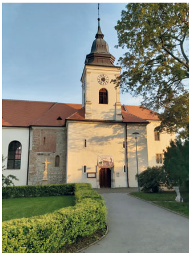
Kostel svatého Jiljí, Komárov