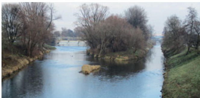
Soutok Svitavy a Moravy

Naše putování začneme na konci ulice Mírová u řeky Svitavy. Ve vodě si můžeme všimnout zbytků základů mostu přes řeku Svitavu, který tvořil spojení s Komárovem ještě před tím, než vznikla dnešní silnice Černovická. Z Černovic se můžete vydat cestou po proudu řeky Svitavy. Pokud půjdete po levém břehu, tak krátce poté, co minete dva železniční mosty, uvidíte po levé straně farmu Ráječek. Kdysi zde stávalo dostihové závodiště a zastavoval zde