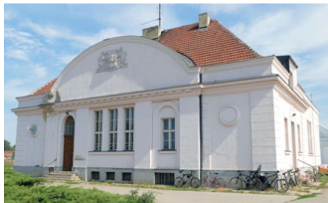
Bývalý vysílač v Ráječku