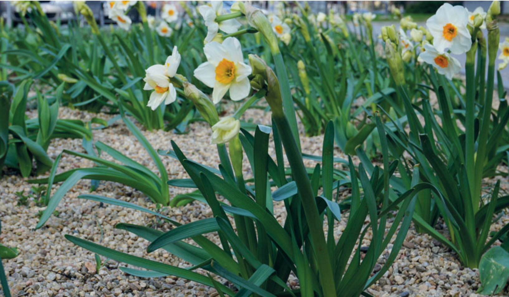
Černovice rozkvétají novými záhonky, které vysadila MČ ve spolupráci se žáky ZŠ Řehořova