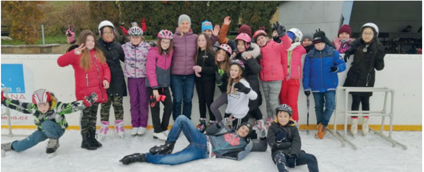
Žáci základních a mateřských škol z Černovic si naplno užívají možnost si zabruslit. Hodiny jsou pro ně vyčleněny dopoledne, odpoledne si však může zabruslit i veřejnost. Více na straně 5. Na fotografii žáci ZŠ Kneslova.