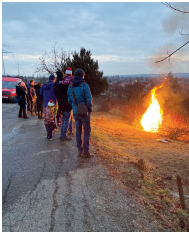
Silvie Zeimerová Sanža předsedkyně Černovického sdružení, z. s.

Věříme, že se nám nejspíše do jara konečně podaří rozloučit s dlouhou covidovou zimou a že se budeme moci potkávat stále veseleji, v hojnějším počtu a hlavně zdraví!