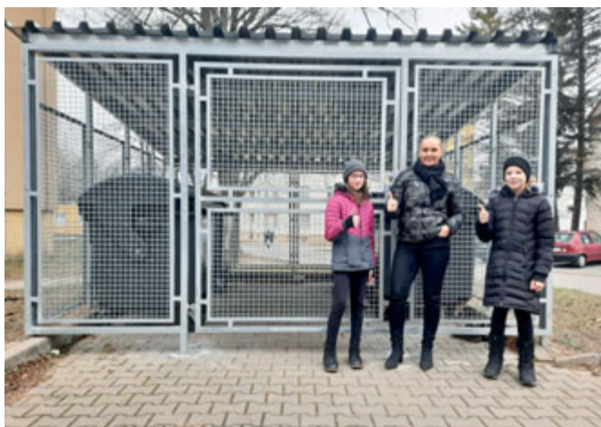
Zastřešená kontejnerová stání

Společnost navíc nabízí i zajímavou službu v rámci projektu Brňáci pro Brno. Stačí si stáhnout aplikaci do chytrého mobilního telefonu a v typu hlášení „odpady“ poslat fotografii přeplněného kontejneru s určeným místem. Dispečeri společnosti pak co nejrychleji zajistí nápravu.