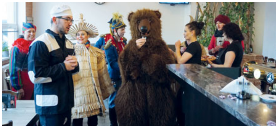
Černovické ostatky 2022