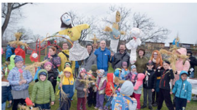
Vynášení Morany z Brna

Druhý návrat po výše zmíněné pauze slaví Společenský a taneční večer s Louisovými sirotky . Večer s dixielandovou kapelou,