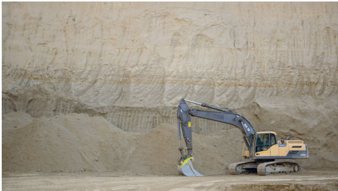
Pískovna Černovice si připomíná 30 let od svého založení. Přečtěte si na straně 5, jak to v devadesátých letech vše začalo.