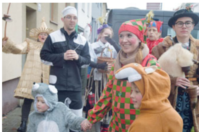
Černovický folklorní soubor Májek spolu s Černovickým sdružením pořádá ostatkový průvod masek již od roku 2016

Příchod jarního období ohlašují také lidové tradice. Zvyky, které se v Černovicích dodržovaly od pradávna, jsme se pokusili